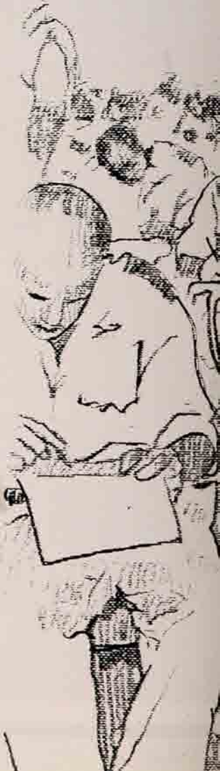
العقيد عبدالله حمزة الرومي