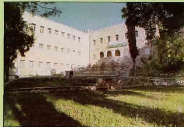
- الدعوة وأصول الدين

أنشئت الدائرة في العام ١٩٧٩م وتمنح درجة البكالوريوس في تخصص الكيمياء الرئيسي وبدأ في العام ١٩٨٢م بطرح تخصص