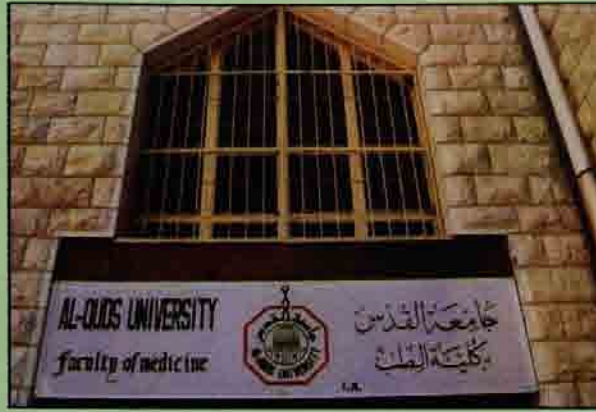
- كلية الطب -

تأسست عام ١٩٧٩م في مدينة البيرة وتمنح درجة البكالوريوس في تخصصات التمريض، الطب المخبري، كما تمنح درجة الدبلوم في تخصص التصوير الشعاعي وفي العام ١٩٩٦م استحدثت برنامج الماجستير في تخصص التمريض (الإدارة في التمريض والأمومة والطفولة).