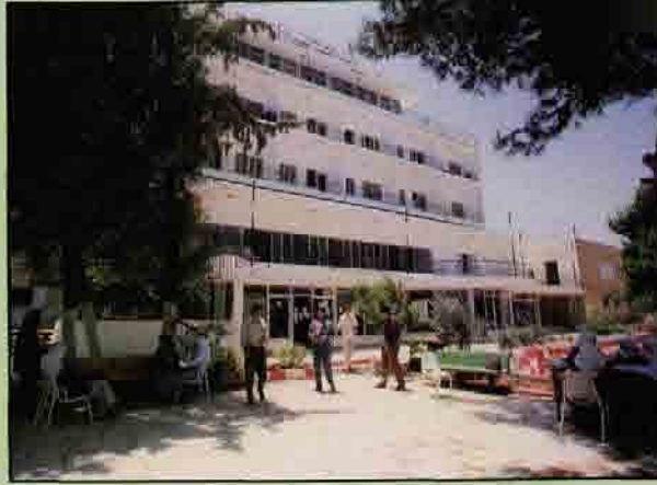
- كلية المهن الطبية

ونظراً لما تتمتع به مدينة القدس من مكانة دينية وأثرية فقد دفعت هذه المكانة العديد من المؤسسات الأجنبية منذ القرن التاسع عشر إلى النظر للمدينة كمركز للبحث الأثري في فلسطين، في الوقت الذي لم تكن فيه أية مؤسسة فلسطينية تعمل على دراسة هذه الآثار بكوادر وطنية متخصصة، وقد أدى ذلك إلى تأسيس المعهد العالي للآثار الإسلامية في القدس عام ١٩٩٢م لتدريب كوادر متخصصة تعمل على دراسة الآثار في القدس وفلسطين ويمنح درجة الماجستير في الآثار الإسلامية لذوي تخصصات الآثار التاريخ والهندسة المعمارية. ويهدف المعهد إلى إيجاد كوادر متخصصة في حقل الآثار وتاريخ العمارة الإسلامية والصيانة والترميم، وتشجيع البحث العلمي في مجالي الآثار وتاريخ العمارة الإسلامية، والعمل على رعاية الحفريات الأثرية للمواقع الإسلامية، والعمل على ترميم الأبنية التي تعود للفترة الإسلامية، إضافة إلى توثيق المعالم المعمارية والأثرية والإسلامية وخلق وعي في مجال التراث المعماري والتاريخ الفلسطيني.