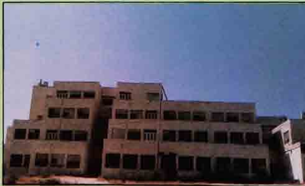
- كلية القرآن والدراسات الإسلامية

وقد تأسس هذا المركز عام ١٩٩٠م وهو متخصص في إجراء بحوث في الأمور المتعلقة بالمجال الصحي، ويعمل على تخزين المعلومات التي تصدر عنه. يهدف المركز إلى التفاعل مع المؤسسات الصحية الوطنية ومراكز