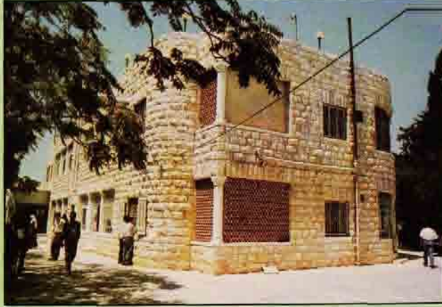
- كلية الحقوق

المتداخل، ويكون تقييم الطلبة بشكل مستمر خلال فصول وسنوات الدراسة وتستخدم في ذلك الأساليب المتعددة من امتحانات تحريرية وشفوية وعملية وسريية، ويشترك في امتحانات السنة الأخيرة ممتحنون بارزون من الخارج. وتشمل مشاريع الكلية إنشاء مبنى خاص لها في حرم الجامعة في أبو ديس وكذلك إنشاء مستشفى جامعة القدس، مجاوراً لمبنى الكلية.