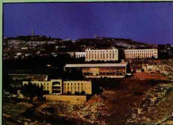
- كلية العلوم والتكنولوجيا -

أنشئت الدائرة عام ١٩٧٩م، وتمنح درجة البكالوريوس في تخصص حاسب الإلكتروني كما تطرح تخصصاً فرعياً في التكنولوجيا الإلكترونية، وقد استحدثت برنامج الماجستير في الحاسب الإلكتروني ولأول مرة في فلسطين الشرق الأوسط في العام ١٩٩٦م بالتعاون مع جامعة كيبيل البريطانية. يقوم القسم بعملية التدريس العملي في مختبرات الحاسوب الحديث في الكلية، يقوم القسم حالياً بالعمل على إنشاء مركز بحث متطور في هندسة وقواعد بيانات.